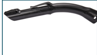
Handgreep zuigbuis kunststof (1 stuks)