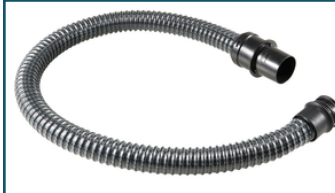
Stofzuigerslang 32x1000mm (1 stuks)