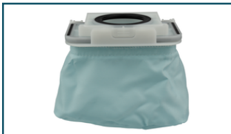
Linnen stofzak ruggedragen stofzuiger (1 stuks)