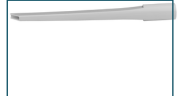
Kierzuigmond lang wit (1 stuks)