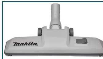
Vloerzuigmond harde vloer&tapijt (1 stuks)