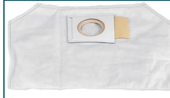
Fleece stofzak ruggedragen stofzuiger (1 stuks)